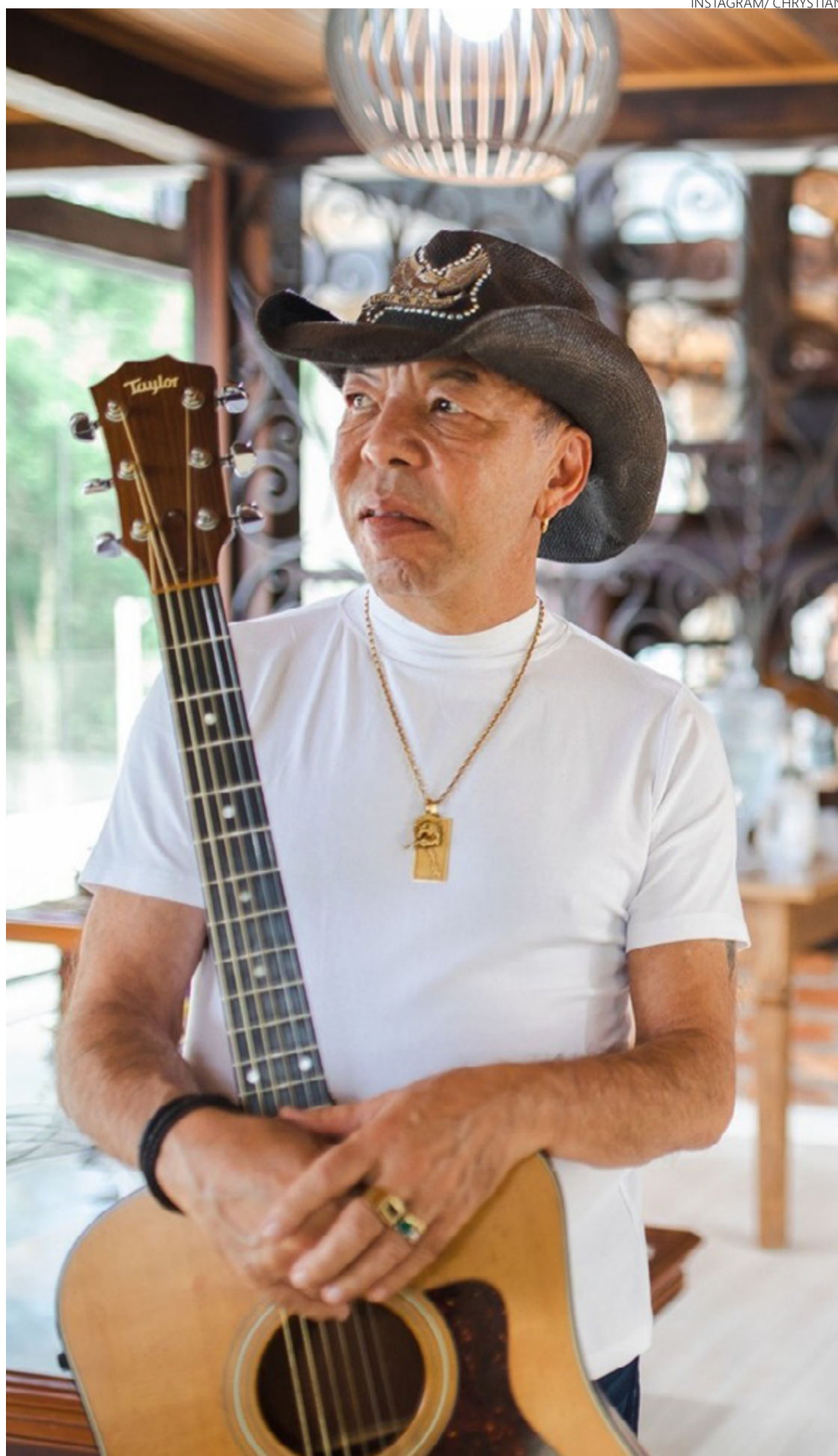
Cantor refinou sertanejo com lirismo, epopeia e flerte com blues, rock e latinidade

dbye”, “Tears” também lembra qualquer balada funk-soul da Motown. Murmura Chrystian na primeira estrofe da canção: “Toda vez que vejo seu rosto/ É somente num retrato na parede/ Ela me leva a todos os lugares/ Que costumávamos ir”.