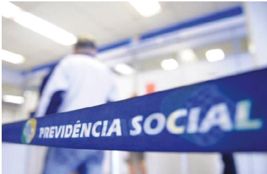
Em 2024, a revisão do pente-fino começou com o auxílio-doença e, em breve, incluirá o benefício assistencial