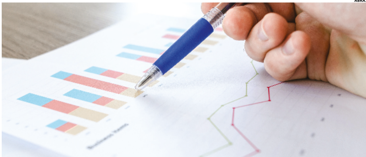
Dúvidas surgiram na cabeça do eleitor anapolino nas últimas semanas, diante de pesquisas com números tão diferentes entre elas

A provocação da Justiça pode ser da parte interessada, no caso alguém que se sentiu prejudicado com a pesquisa: um candidato, um partido ou mesmo coligação. É claro que a denúncia precisa ter base: não se pode