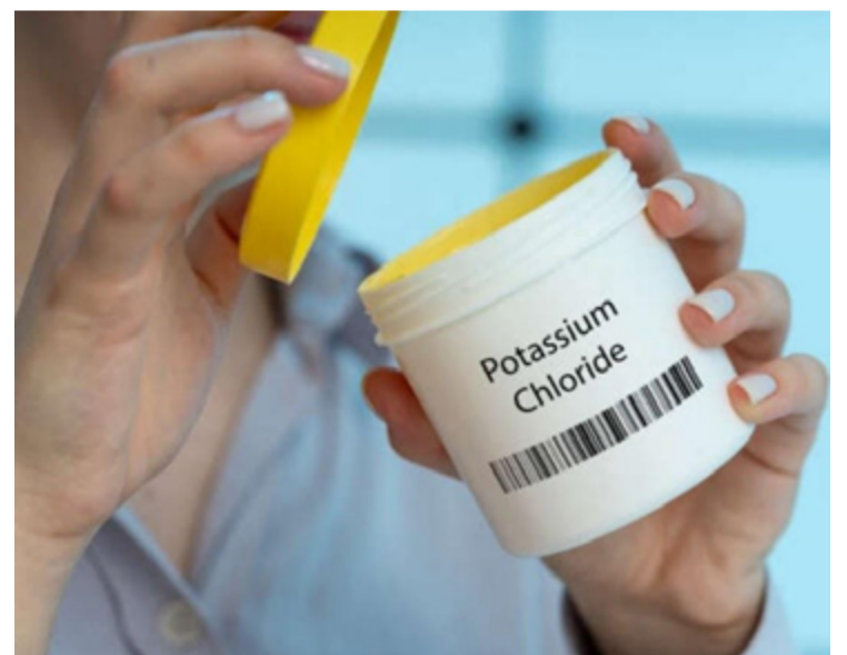
Suplementação de potássio pode ser uma solução eficaz para combater a hipertensão

A suplementação de potássio pode ser uma solução eficaz para combater a hipertensão associada ao consumo excessivo de sal. Promover o uso de sal enriquecido com potássio pode trazer grandes benefícios para a saúde pública, sendo uma intervenção de baixo custo e potencialmente mais fácil de implementar do que a redução drástica do consumo de sal.