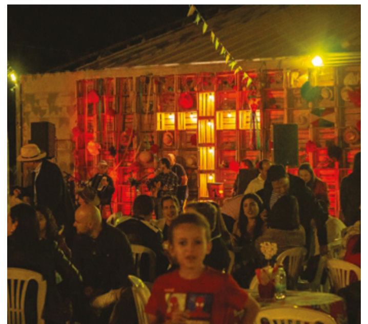
Evento festivo beneficente é realizado pela Mosaico Igreja Presbiteriana, do Residencial Anaville, nos dias 5 e 6 de julho

A programação será especial principalmente para as crianças, com brinquedoteca e a participação da Patrulha Canina. Além do Núcleo Esperança, o Projeto Resgate, que contribui para tirar crianças da rua, além de ajudar famílias carentes, também será contemplado com os recursos arrecadados.