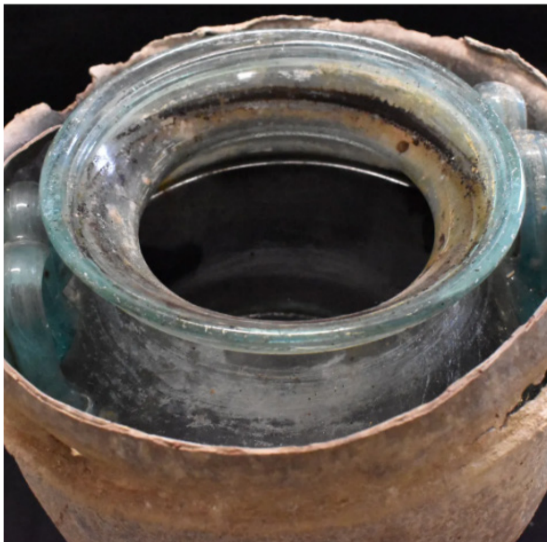
Explicação para preservação do vinho reside em selo hermético