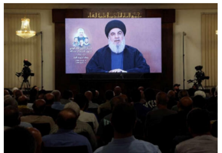
Hezbollah, grupo libanês pró-iraniano, aumenta risco de uma guerra em grande escala no Oriente Médio

A situação na fronteira entre Israel e Líbano está extremamente tensa, com o risco de uma guerra em grande escala mais alto do que nunca. A comunidade internacional, especialmente os Estados Unidos, está tentando mediar a situação para evitar um conflito maior. A retórica do Hezbollah, embora agressiva, pode ser uma estratégia para evitar uma escalada, mas a situação permanece volátil e imprevisível.