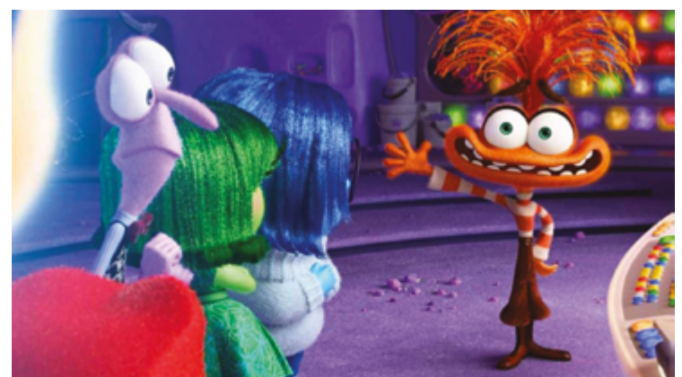
Lançamento traz a tona sentimentos de uma adolescente na puberdade e muitas novas emoções surgem; os ingressos já podem ser adquiridos

Além de Anápolis, o Cine + Azul deve acontecer em outras cidades como Catalão (GO), Goiânia (GO), Guaratinguetá (SP), Juiz de Fora (MG), Montes Claros (MG) Patos de Minas (MG) e Uberaba (MG).