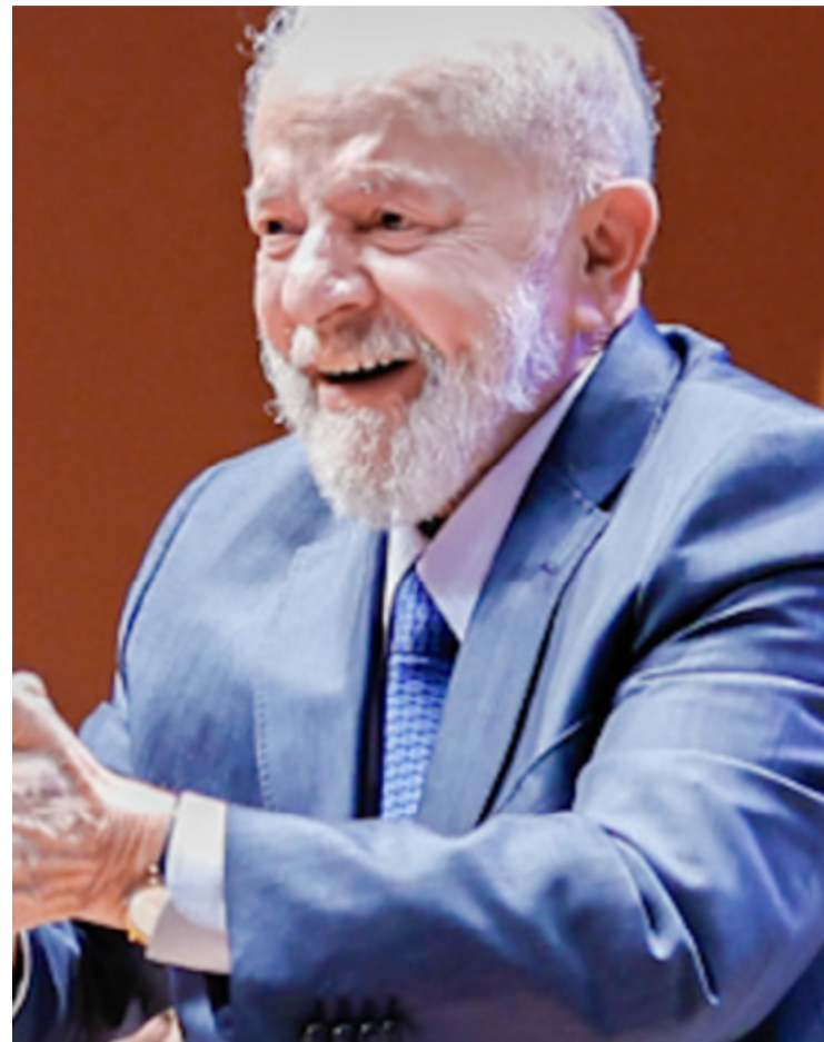
Lula da Silva: ataques à Operação Lava Jato formada pela Justiça brasileira

É importante lembrar que a Operação Lava Jato, que investigou desvios na Petrobras, completou 10 anos agora em março. Ao longo da última década, a operação conseguiu recuperar R$ 2 bilhões para os cofres públicos por meio de acordos de delação premiada e de leniência homologados pelo Supremo Tribunal Federal (STF).