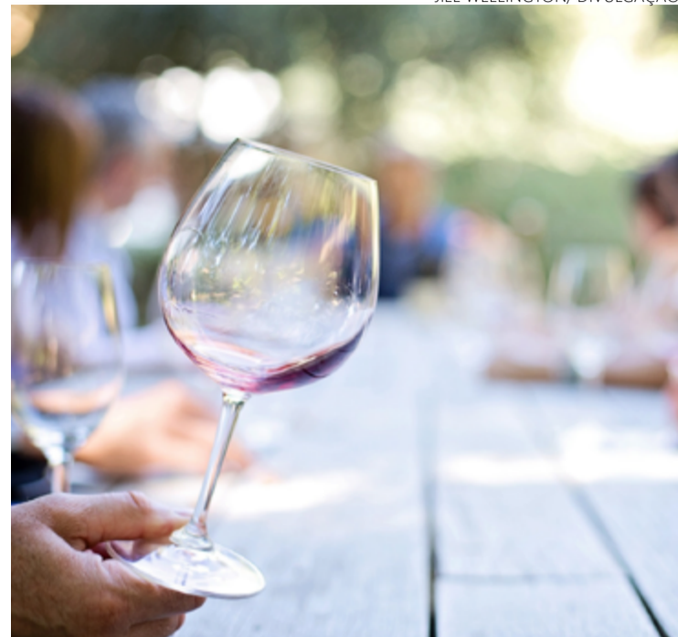
Idealizador diz que evento surgiu para dar visibilidade à produção local