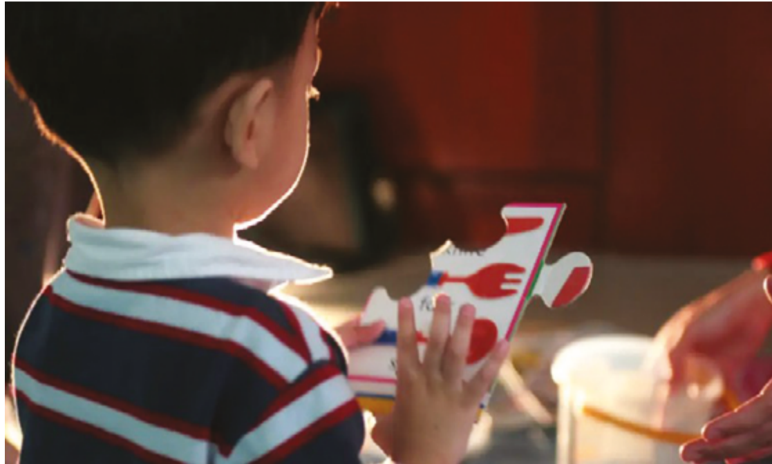
O diagnóstico em crianças é mais perceptível, enquanto, em adultos, fatores podem gerar confusão

A médica ressalta que a maior descoberta do autismo em adultos se deve ao aumento do conhecimento dos profis-