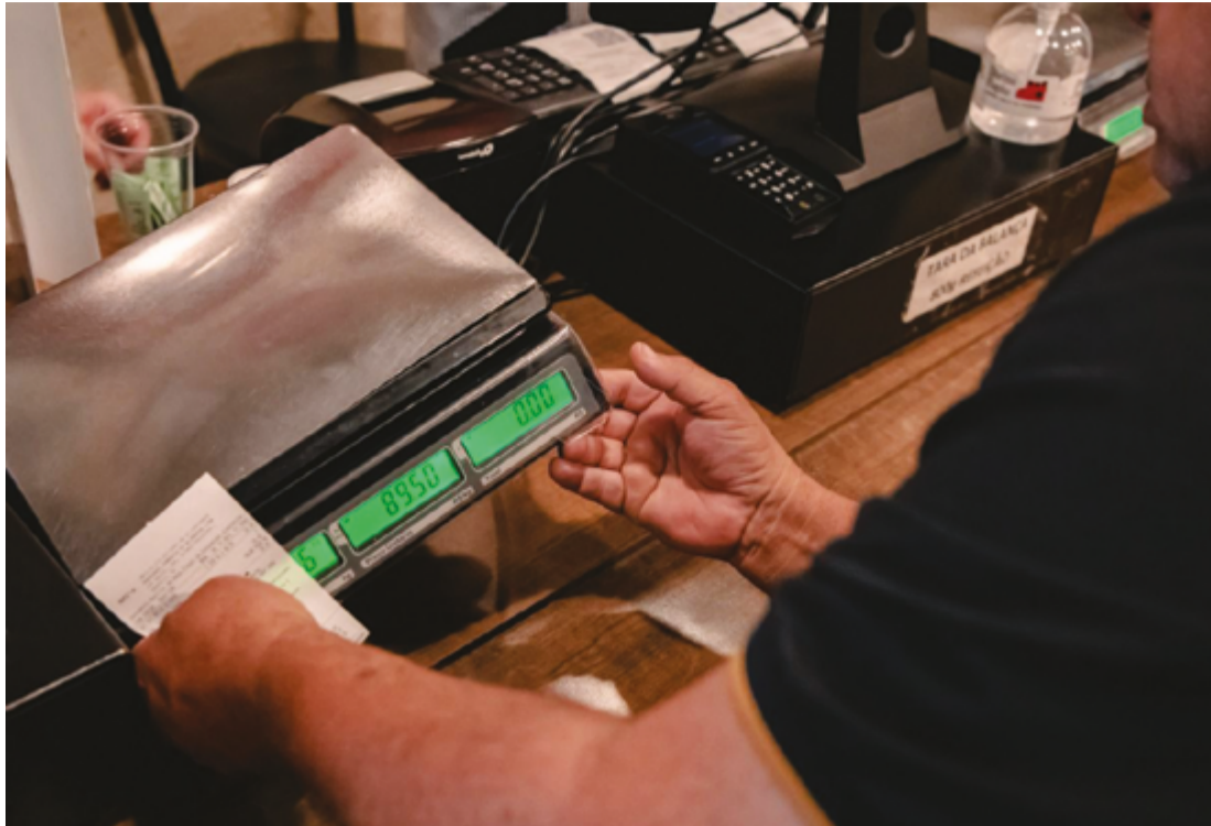
Caso os fiscais constatarem irregularidade, o Inmetro irá emitir notificação, multa e um processo administrativo