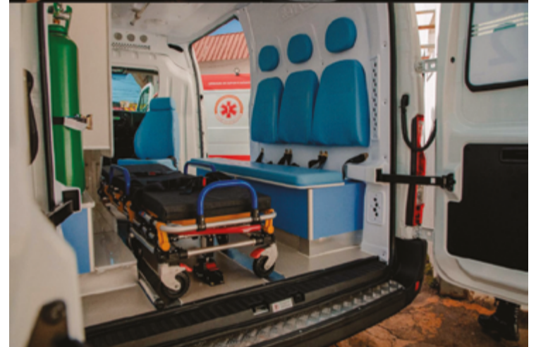
Novas ambulâncias do Samu, entregues nesta quinta, 20, têm equipamentos modernos e foram todas adquiridas com 100% de recursos do município

não para”. Disse também que a Unidade de Suporte Avançado (USA) conta com equipe formada por médico, enfermeiro e condutor, para atender casos mais graves como acidentes de trânsito. Conta com equipamentos como ventilação mecânica, bomba de infusão, entre outros.