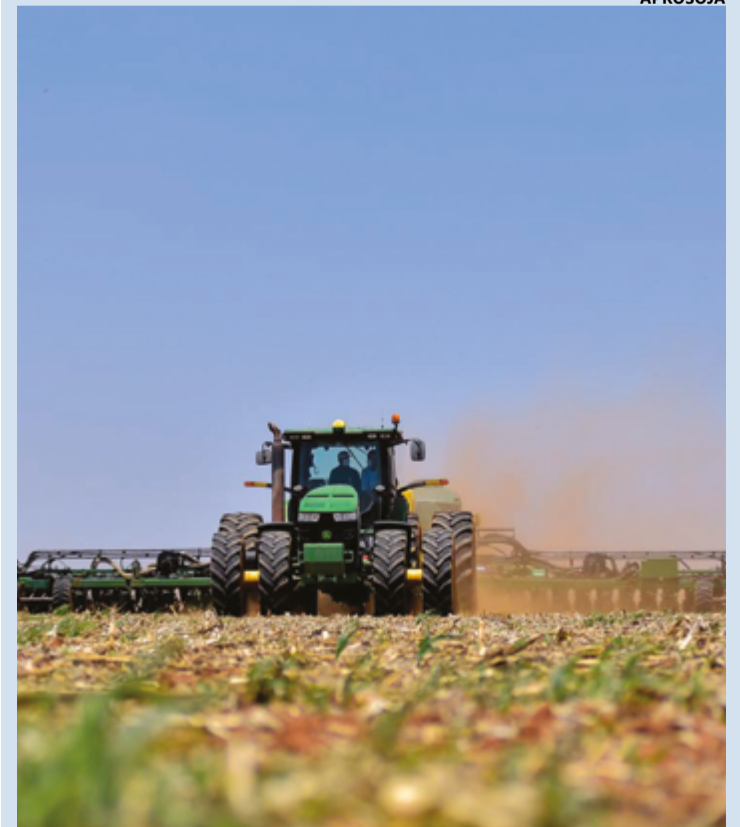
Com mais de 40 dias consecutivos sem chuvas, o estado de Goiás enfrenta uma de suas piores secas das últimas três décadas